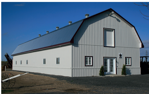
IMPÉRIAL - MOULURES ASSORTIES : SÉRIE 800 (OUVERTURE 1")